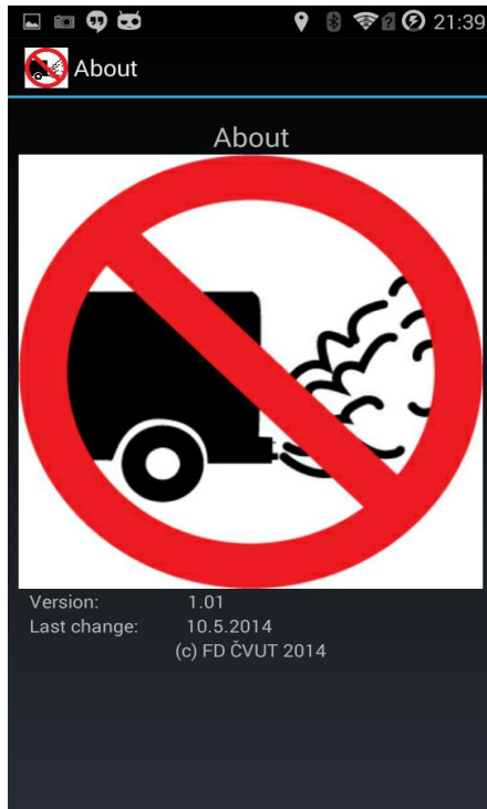
Obr. 1 - Screenshot aplikace (About)