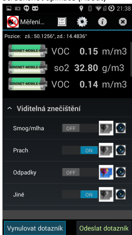
Obr. 3 - Screenshot aplikace (data senzoru)